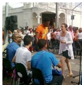
La hija de Raúl Castro tiene una agenda política para blanquear la homofobia histórica de la revolución

CIENFUEGOS, Cuba -Durante la última década, la lucha en favor de los derechos de la comunidad LGBTI cubana ha cobrado relevancia. Ha sido el Centro Nacional de Educación Sexual de Cuba (CENESEX) dirigido por la sexóloga Mariela Castro Espín, hija del gobernante cubano Raúl Castro Ruz, la organización más visible de cuantas aseguran estar involucradas en la promoción del respeto a la diversidad de género; gran paradoja si se tiene en cuenta que fue su tío Fidel Castro y su padre, quienes instrumentaron la mayor persecución contra la comunidad gay que haya quedado registrado en los anales de la Isla.