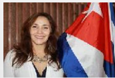
Mariela Castro Espín

Sabido históricamente es que cuando un movimiento comienza y surge desde abajo, es decir el pueblo; es porque el mismo necesita que se generen cambios de un estado el cual no representa ni tiene en cuenta sus derechos. (Continúa pág.3)