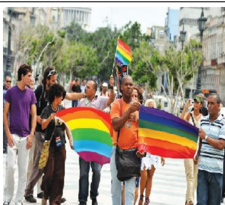
Un reducido grupo de activistas independientes cubanos celebró en junio de 2011 por primera vez una marcha por el Día del Orgullo en La Habana.

hace sus propuestas sexuales. "Voy al grano. 40 pesos por sexo oral y 100 por una completa. Siempre aclaro que soy travesti, no quiero líos. Es que cuando salen de fiestas o discotecas, pasados de tragos, me confunden con una mujer.